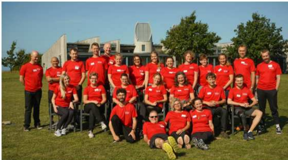
Fig. 1: Sahva-medarbejdere på Løbeskole 2021

Vi har en målsætning om kontinuerligt at højne medarbejdertilfredsheden i Sahva. Derfor får vi hvert andet år udført medarbejdertilfredshedsundersøgelser i organisationen. Den seneste undersøgelse er foretaget primo 2022 og resultatet omtales nedenfor.